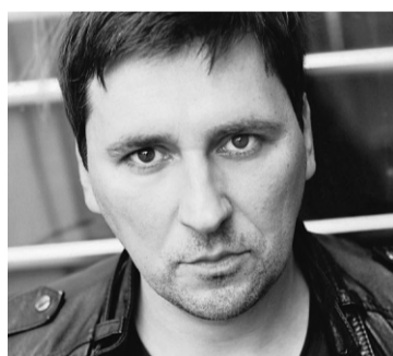
IVAN VRGOČ, glumac, Berlin

Njemački glumac podrijetlom iz Splita je odglumio 150 uloga, producirao 4 filma, najpoznatiji mu je "Der Zeichner". Bavio se i sportom. Najveće sportske rezultate postigao je u kickboxu, gdje uživa veliki ugled kao višestruki šampion. Više puta je bio prvak Njemačke, tri puta europski prvak i čak pet puta svjetski prvak. 2011. godine, je upisan kao najstariji svjetski prvak u kickboxingu. Kao tjelehoranitelj je čuvao brojne poznate osobe među kojima su i modni dizajner Wolfgang Joop, te političar Miroslav Tuđman. Najpoznatiji je ipak postao kada je obranio dvije žene od izgreznika u novogodišnjoj noći u Kölnu, a video s njegovom ispovijesti pogledali milijuni ljudi diljem svijeta.