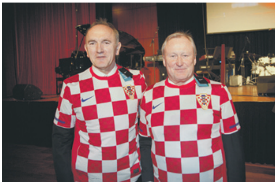
Raspoloženi urednik Večernjakova inozemnog izdanja i gradonačelnik Bad Homburga

Veselili se Hrvati iz BiH, Švicarske, Nizozemske, Austrije i Njemačke