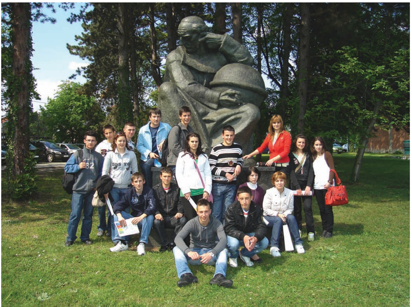
Slika 1. Meštrovićev spomenik Ruđeru Boškoviću postavljen u institutskom parku idealno je mjesto za skupno fotografiranje.

U četvrtak, petak i subotu, od 24. do 26. travnja ove godine, na Institutu »Ruđer Bošković« (IRB) vladala je neobična živost. Treći puta u zadnjih nekoliko godina Institut je otvorio svoja vrata pruživši priliku svim zainteresiranim građanima da tijekom trajanja Otvorenih dana IRB-a obiđu zgrade i laboratorije, razgledaju pribor i uređaje kojima