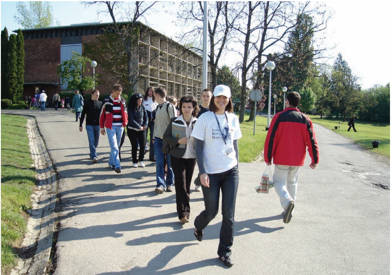
Slika 21. Povratak s obilaska Instituta po zelenoj stazi. Za jedne kraj razgledavanja, a za druge tek početak novoga.

davanja, i potom sat vremena u obilasku jedne (i samo jedne) staze te tako razgleda tek četiri točke od mogućih šesnaest, bio je nemali broj onih koji su se nakon prolaska jednom stazom, oduševljeni viđenim, odlučili za drugu, pa treću, a neki i za sve četiri! Pojedini su posjetitelji čak dolazili dva dana za redom kako bi razgledali ono što prethodnoga dana nisu stigli vidjeti (sl. 21.).