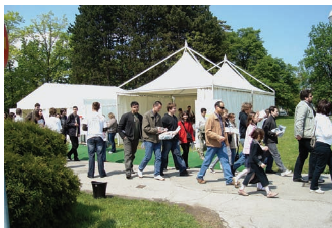
Slika 5. Grupa posjetitelja kreće se iz šatora prema predavaonici prvog krila.

Plava dvorana opremljena je najsuvremenijim tehničkim pomagalicama za predavanja i video-konferencije, dok dvorana