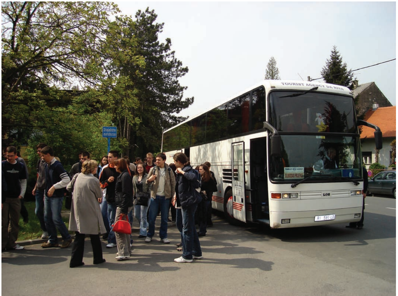
Slika 2. Autobus iskrcava učenike pred ulazom u Institut.

Osim školaraca, među posjetiteljima je bilo i organiziranih grupa studenata s triju fakulteta Sveučilišta u Zagrebu (Kineziološki fakultet, Prehrambeno-biotehnološki fakultet i Prirodoslovno-matematički fakultet, smjer fizika) te studenata Tehničkog fakulteta Sveučilišta u Rijeci i Fakulteta prirodoslovno-matematičkih znanosti i kineziologije u Splitu. Institut su, nadalje, posjetili članovi sedam diplomatskih