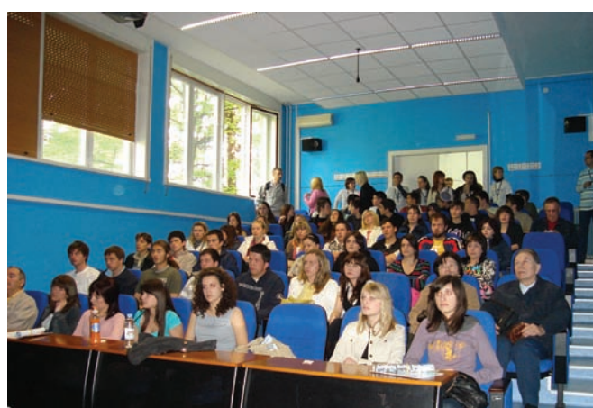
Slika 6. Posjetitelji u Plavoj dvorani očekuju početak predavanja.