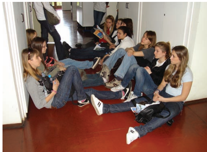
Slika 14. Prethodna se grupa zadržala malo dulje nego što je predviđeno, što je bila dobra prilika za kratki predah između dviju točaka.

Obilazak žutom stazom završio je pričom o ekstremofilima, organizmima koji su se prilagodili životu u ekstremnim uvjetima. Jedan takav ekstremofil je gram-pozitivna, crveno pigmenti-