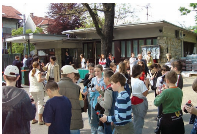
Slika 4. Dio atmosfere koja je tijekom Otvorenih dana vladala na ulazu u Institut.